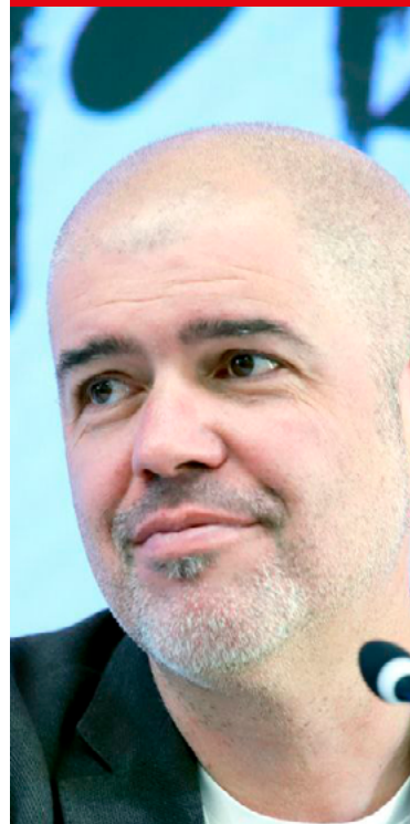
Unai Sordo Secretario general de CCOO